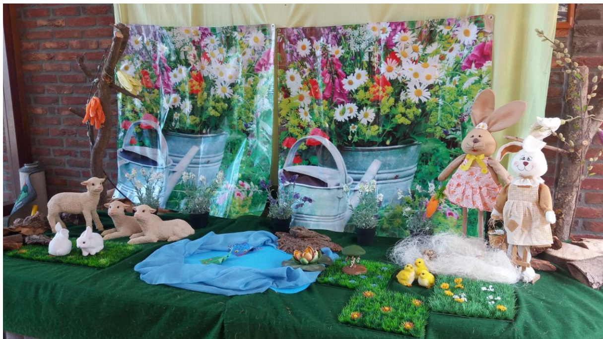
De seizoenentafel in de huiskamer van onze school!